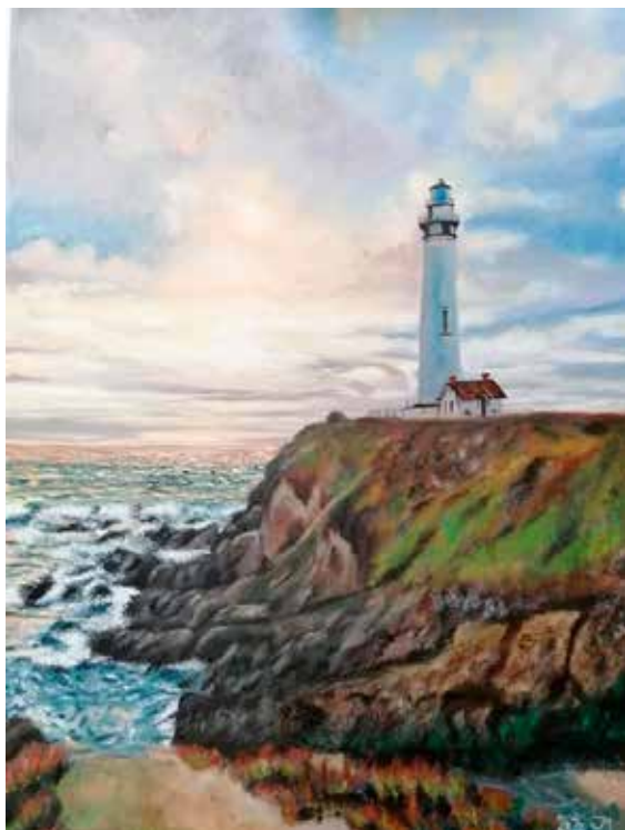
Maják olej na plátně, 2020