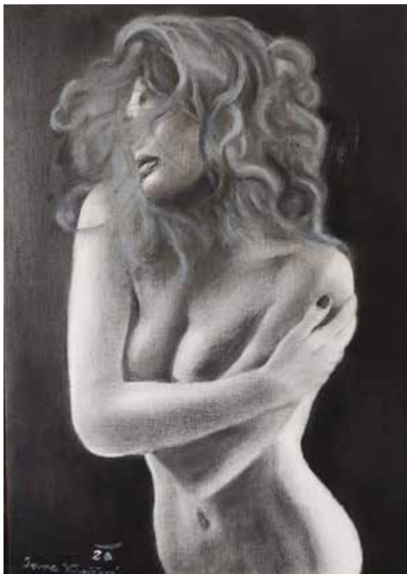
Akt suchý štětec na plátně, 2020