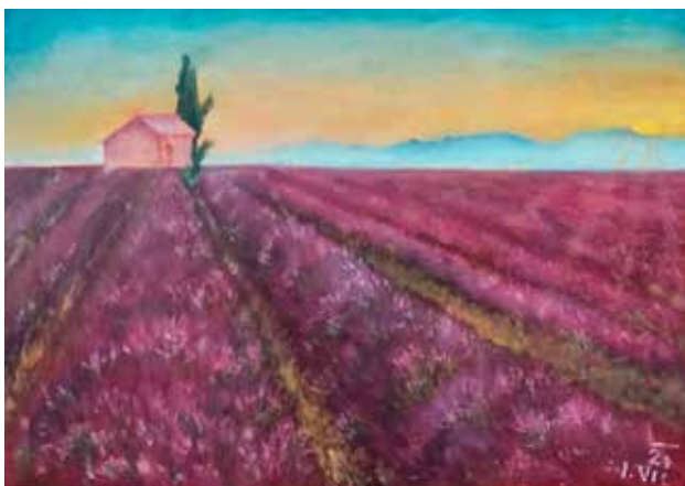
Levandulové pole olej na desce, 2020