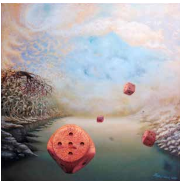
M.K.: Minulé životy IV olej na plátně, 2020