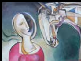
obálka: Ument Delger: Zasněná, olej na plátně, 2006

Snail Golf Úholičky T: 603 909 577 petr.sedina@golfsnail.cz www.golfsnail.cz