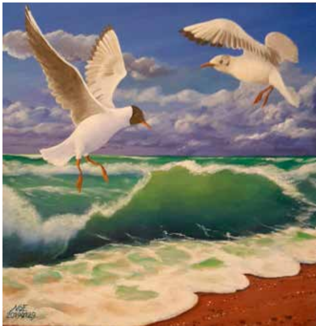
Na jedné vlně akryl na plátně, 2019

Jmenuji se Evžen Novák a narodil jsem se 29. června před 62 lety. Snad právě to teplo, slunce, dozrávající třešně a všechny letní vůně formovaly můj optimistický vztah k životu. A také učitelská rodina, ve které na mě měl vždycky někdo čas. A určitě i prostředí historického Lokte nad Ohří, kde jsem strávil první tři roky života.