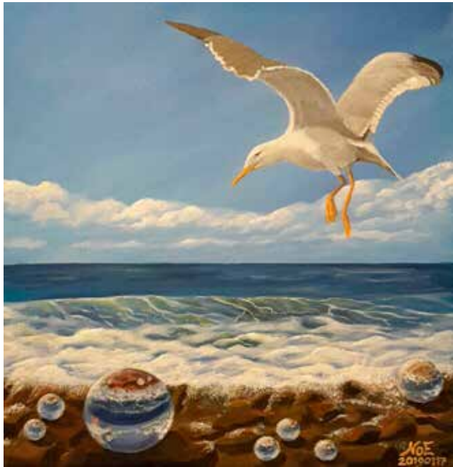
Poseidonovy slzy akryl na plátně, 2019