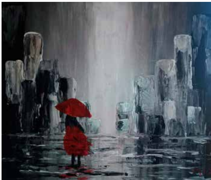
Deštivý den akryl na plátně, 2020