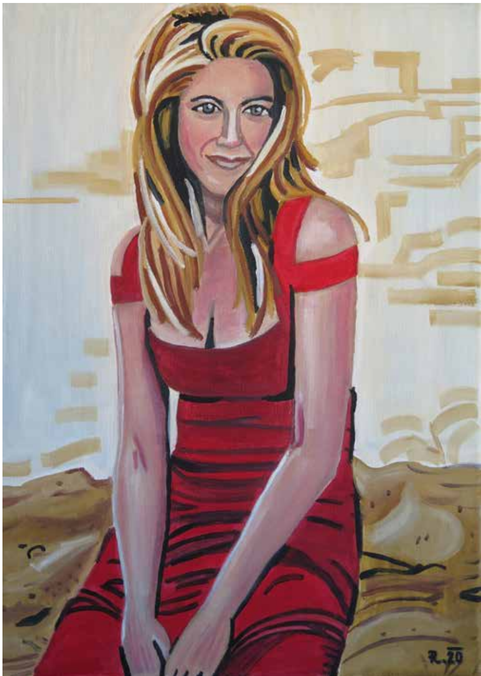
Dokonalý život olej na plátně, 2020