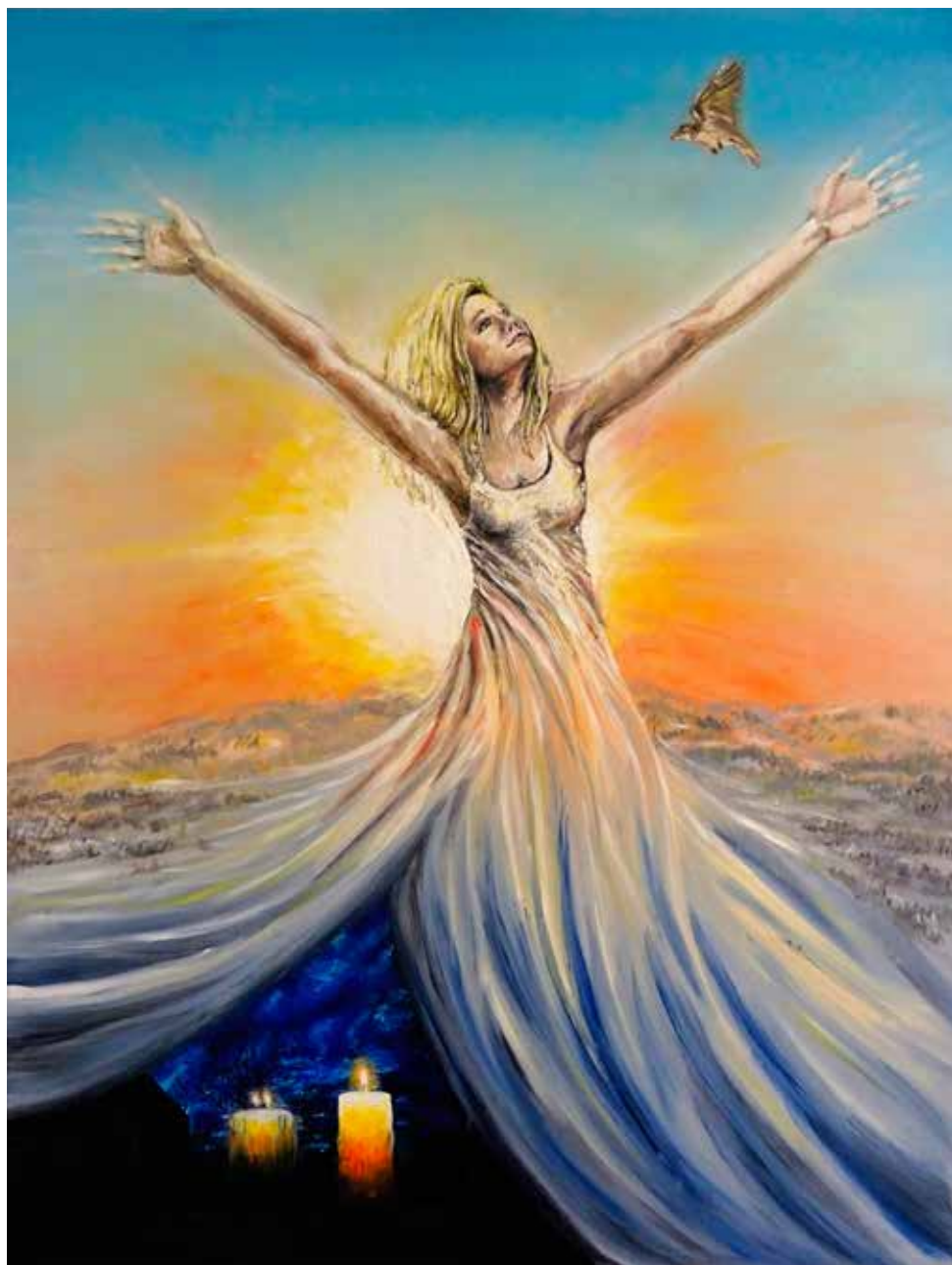
Imbolc – Hromnice olej na plátně, 2019