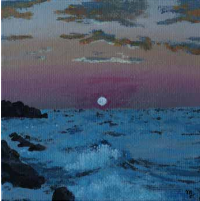
Trilogie západu slunce akryl na plátně, 2020