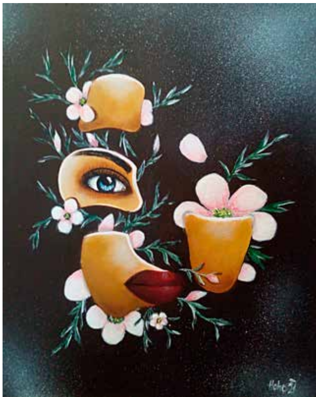
P.H.: Koláž akryl na plátně, 2020